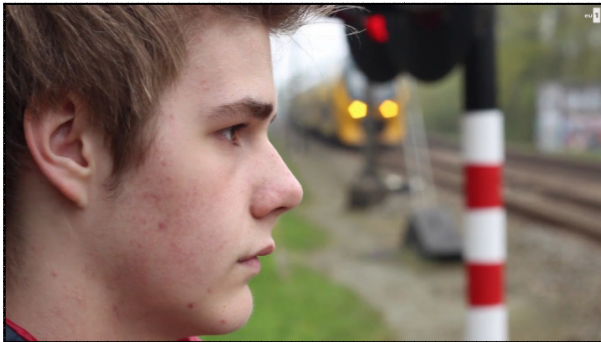
Moviestill uit de film Ruben

De film "Ruben" gaat over homoseksualiteit en over pesten. In de film van 10 minuten wordt de 15 jarige Ruben gepest omdat hij homo is. Een structurele aanpak op scholen tegen pesten is de kern van hun aanpak. Daarbij gaat het niet alleen om gebrek aan kennis, maar vooral om gedragsverandering enorm jonge homos en lesbiennes zekerder van zichzelf en weerbaarder te maken, maar ook om het groepsproces van pestkoppen te doorbreken.