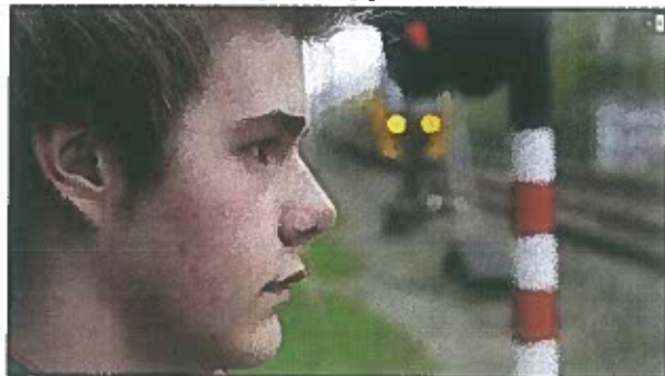
Moviestill uit de film Ruben

Daarbij gaat het niet alleen om gebrek aan kennis, maar vooral om gedragsverandering enorm jonge homos en lesbiennes zekerder van zichzelf en weerbaarder te maken, maar ook om het groepsproces van pestkoppen te doorbreken.